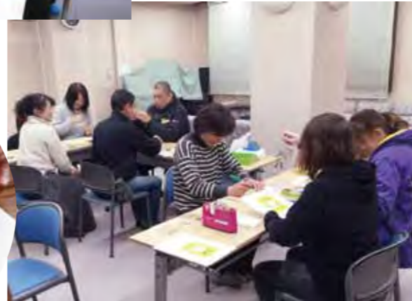
安全で健やかにの願いを込めて楽しい作業中!