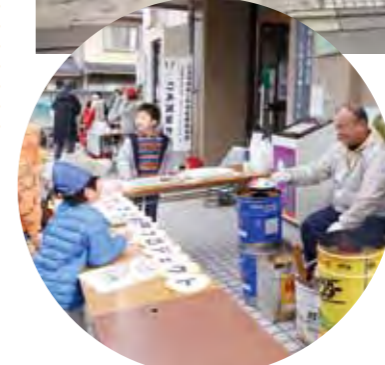
ロケットストーブも大人気!?