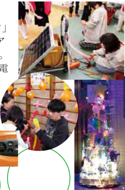
Xmas イルミネーションにも使用