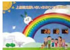
Xmas イルミネーションにも使用