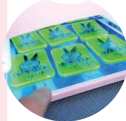
レジンを塗って、UVライトで硬化。