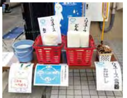
リユース食器でエコイベントに貢献。