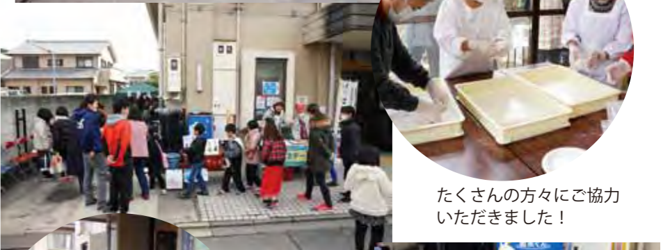
たくさんの方々にご協力 いただきました!