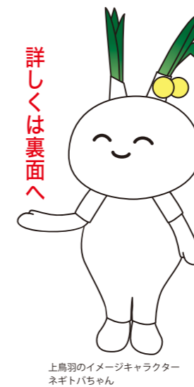
上鳥羽のイメージキャラクター ネギトバちゃん

プロジェクト発足から4ヶ月 「見守りストラップづくり」、 「ラジオ体操」と、少しずつ みんなの想いを形にしています。 まだまだ始まったばかりのプロジェクト、 地域の皆さんの手助けが必要です。 「こんなことしたい」、「あんなことできたら」、 そんな皆さんの想いや願いをお聞かせください。 プロジェクトと一緒に形にしていきたいと思います！