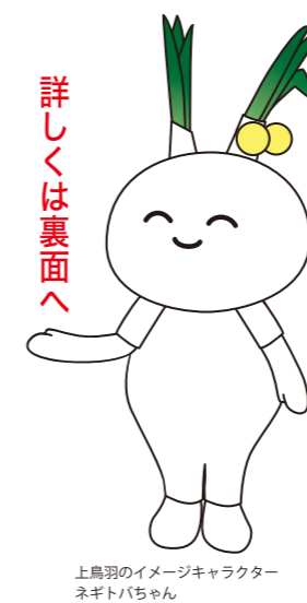
上鳥羽のイメージキャラクター ネギトバちゃん