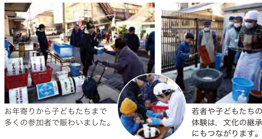
お年寄りから子どもたちまで多くの参加者で賑わいました。

2月2日（土）毎年恒例のおもちつき大会が開催されました。自治連合会を始め、各種団体、児童館、南エコまちステーションなど、たくさんの方々にご協力いただき、上鳥羽の人・心・想を“つなぐ”地域交流の場として大いに盛り上がりました。事前告知により他地域の方の参加もあって、去年より多くのおおよそ200人の方々に参加していただき、きなこ・みそ汁・ぜんざい全て大盛況でした。いきセンの事業告知やロケットストーブの実演（ポップコーン調理）など、多くの方に興味を持ってご覧いただきました。日本の伝統行事の一つである「おもちつき」を通じて、親睦を図りよりよいまちづくりを推進していきたいです。