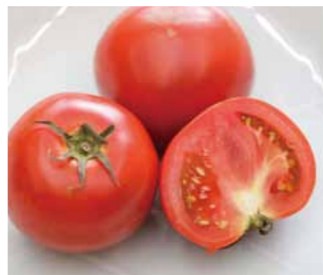
ぜいたくトマト（大玉トマト）

甘みと酸味のバランスに優れ、濃い味わいのトマトです。生で食べても美味しく、調理すると、とろけるような滑らかさと、ほどよい酸味が料理にコクと美味しさをプラスします。一般的なトマトに比べ、リコピンが約2倍含まれています。