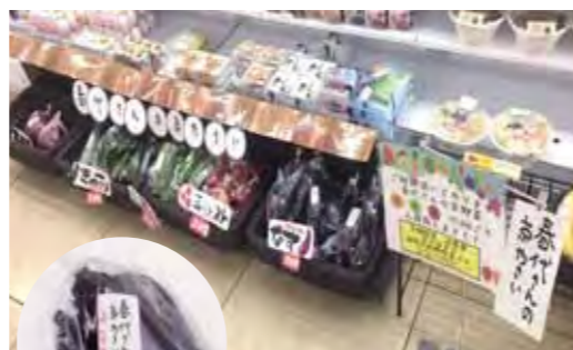
セブン・イレブン 春代さんの京やさい 好評発売中！ おなす

甘みと酸味のバランスに優れ、濃い味わいのトマトです。生で食べても美味しく、調理すると、とろけるような滑らかさと、ほどよい酸味が料理にコクと美味しさをプラスします。一般的なトマトに比べ、リコピンが約2倍含まれています。