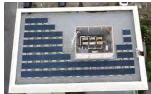
センター屋上に62枚の太陽光パネルを設置しています。