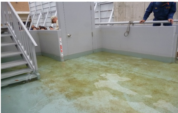
水圧体験（水槽に張った水）