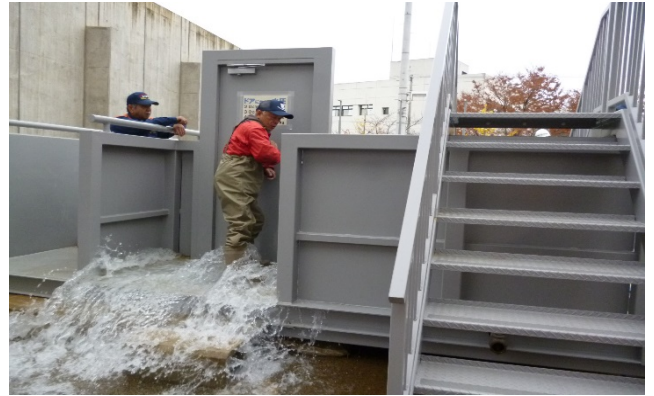
水圧体験（ドアにかかる水圧を実感）