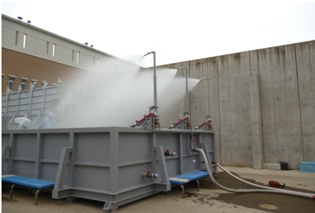
80mmの豪雨を体験（ポンプ車で発生させる）