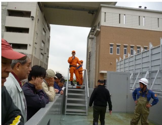
水の流りに逆らって歩く