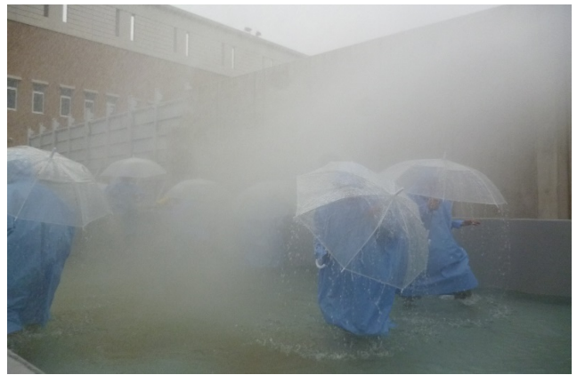
豪雨の中を傘、カッパを着用し歩く